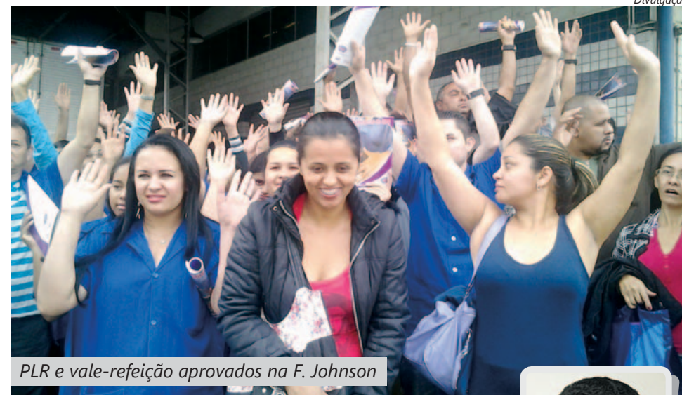
PLR e vale-refeição aprovados na F. Johnson

Na F. Johnson, em Diadema, os companheiros aprovaram tanto a PLR quanto o reajuste no vale-refeição para este ano durante assembleia na porta da fábrica na terça-feira.