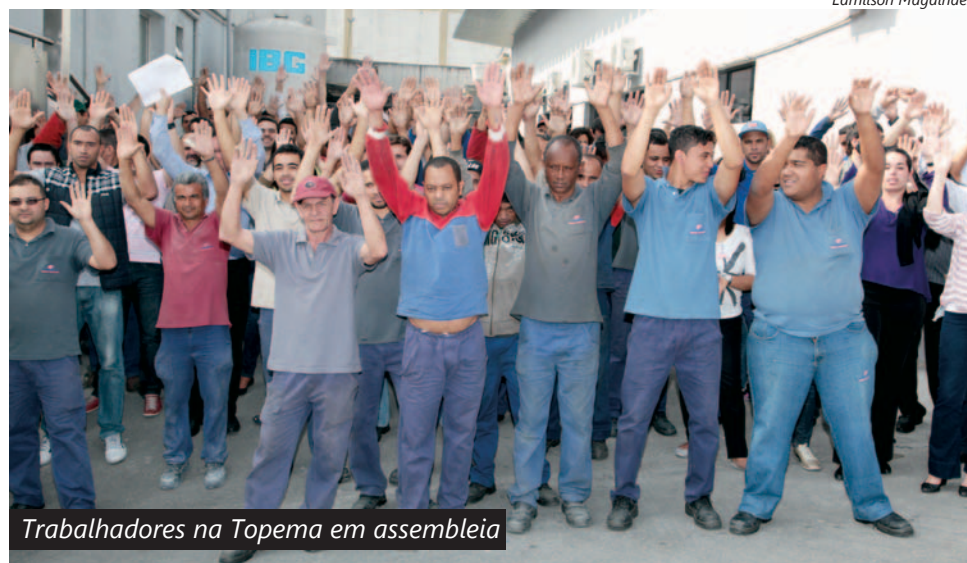
Trabalhadores na Topema em assembleia

Os estagiários no grupo Topema, que engloba as empresas American Cooler, Fagobras e Top Master, em Diadema, também receberão a PLR deste ano. A decisão foi tomada durante assembleia realizada ontem na porta da fábrica.